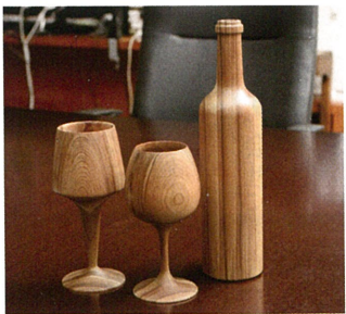
▲ 写真は商品化されたものではありませんが、木製のサンプルとして作成されたもの。実際の商品や木製のサンプルがあることにより、様々なアイデアが出てくるのは、とても不思議です。