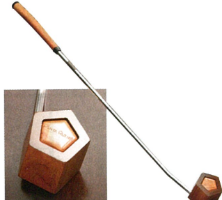
▲ ペンタバター・ウッドー 特許技術を使い国産のヒノキを圧縮した木材と正五角形の特徴を活かし、どこにあたってもスイスポットとなるバター。ゴルフの聖地、英国セントアンドリュースのショップでも実際に販売されています。