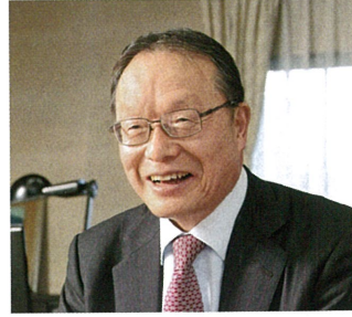
▲ 「人のやらないことをやりなさい、新しいことにチャレンジし、人の役に立つことをやり続ければ、すごく楽しい人生になる」と社員に語る、丹羽社長。