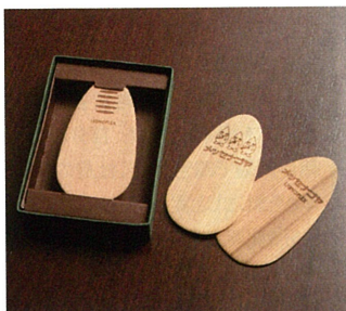
▲ 靴べら「シューホン」 木材の強度を活かしながら柔らかくする技術により生まれた第1号の商品であり、ノベルティグッズとして好評。メッセナゴヤの記念品としても使わせていただきました。