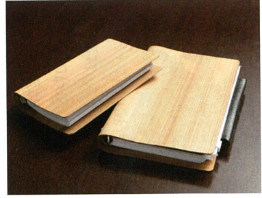
▲ 曲がる木のシステム手帳「iLignos(アイリグノス)」木材圧縮技術によって驚ほどの柔軟性が加えられたシステム手帳。木ならではの心地よさを追求した商品で、ビジネスの現場に温もりを与えるツールとして好評です。