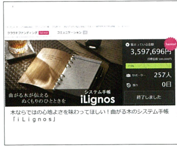
▲ 新しく開発した商品に対する評価をインターネット上で確認するためクラウドファンディングにも挑戦。曲がる木のシステム手帳「iLignos(アイリグノス)」(右商品)は、機能性ととも木ならではの温かみが評価されました。