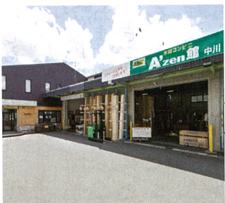
▲ 木材コンビニ「Azen(エイゼン)館 中川」木材のプロショップとしてリフォームや個人のDIY需要の増加にも対応。高品質な木材、最新の住宅設備機器にいたるまで、ホームセンターにはない豊富な品揃えがあります。

現在、多くの企業が、商品開発については自社商品の差別化のため、木という素材に関心があると感じています。というのも商談相手に弊社の商品サンプルを紹介したり、既存商品を圧縮木材でサンプルを実際に作ると、不思議なことにそのサンプル品から、商品の使用方法やPR方法、提携先などアドバイスを次々といただけるのです。これからも様々なアイデアを実現することで、木の魅力や素晴らしさを世の中に広めていく挑戦を続けていきたいと考えています。