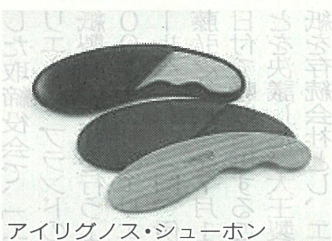
アイリグノス・シューホン

用金庫城下町支店」は八角形・ガラス張りの斬新な外観と、地元額田地区（岡崎市）産の