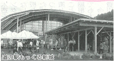
道の駅もつくる新城